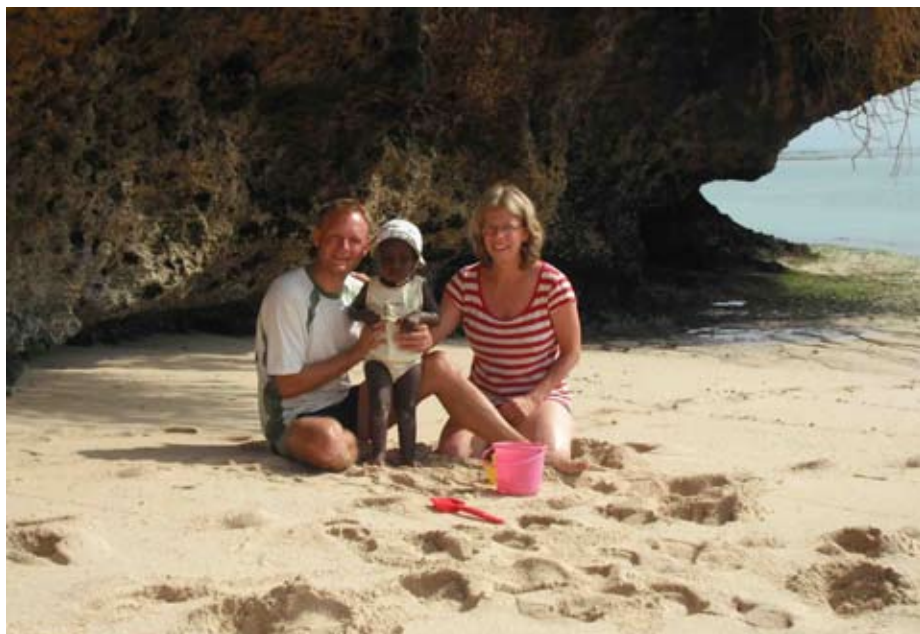
November 2009 - Kusten söder om Mombasa