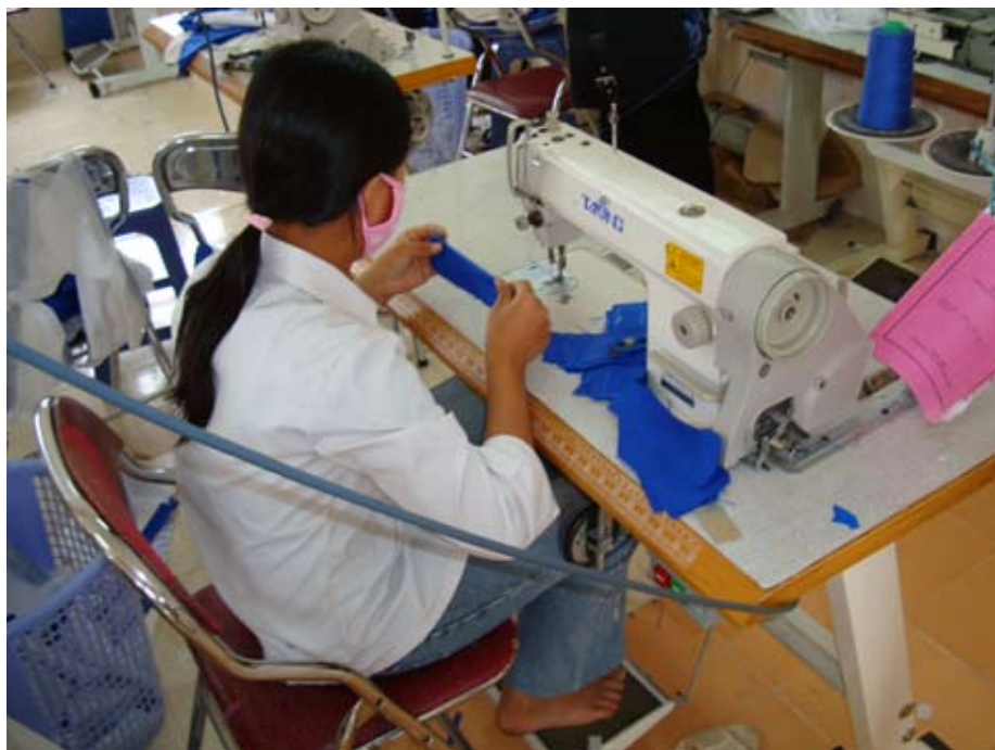
En av flickorna som utbildar sig till sömmerska

Vid vårt förra besök gav vi familjen några foton, som vi hade plastat in för att de inte skulle bli förstörda. Vi hade dels gjort en kopia av det första fotot som vi hade fått på Dang själv, dels två foton på vår