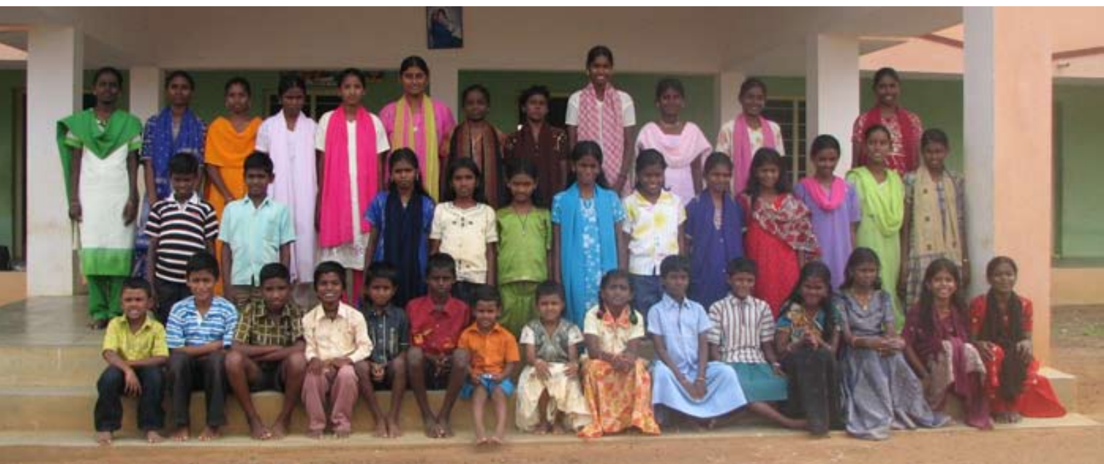
Här är en bild på alla barn som BFA sponsrar på Annai Home i Indien.