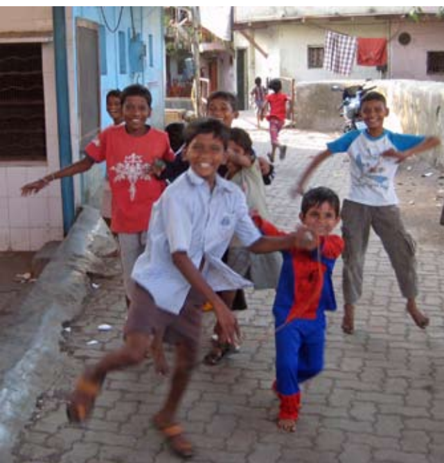
Glada pojkar som leker på en gata i Mumbai, Indien.