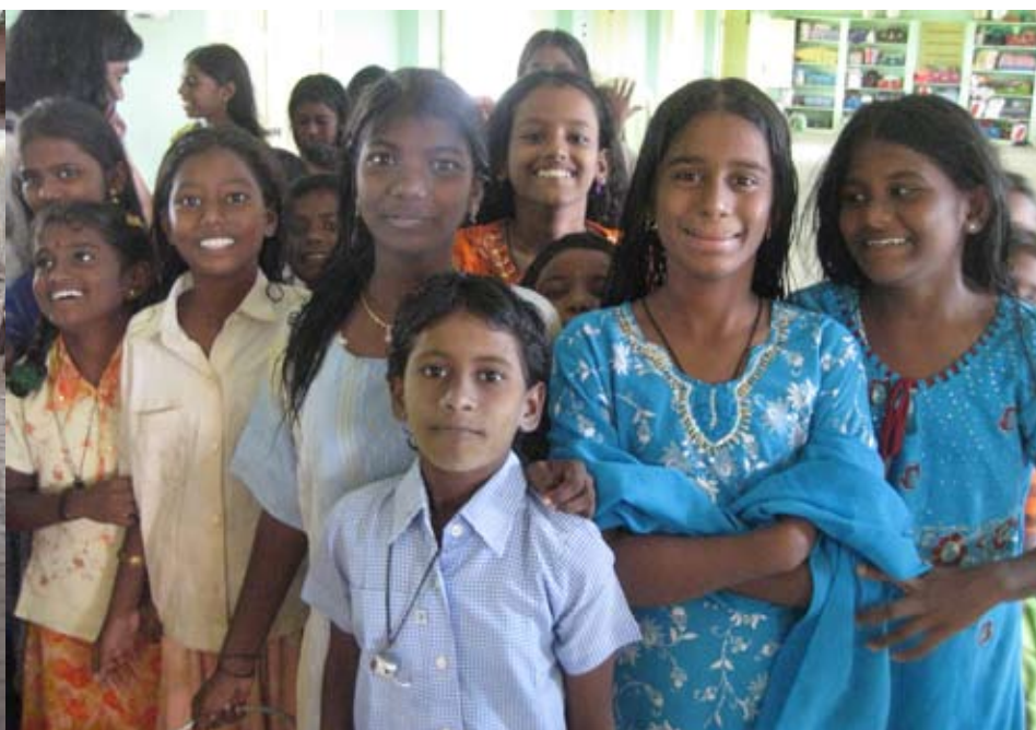
Glada flickor på Annai Home for Children.