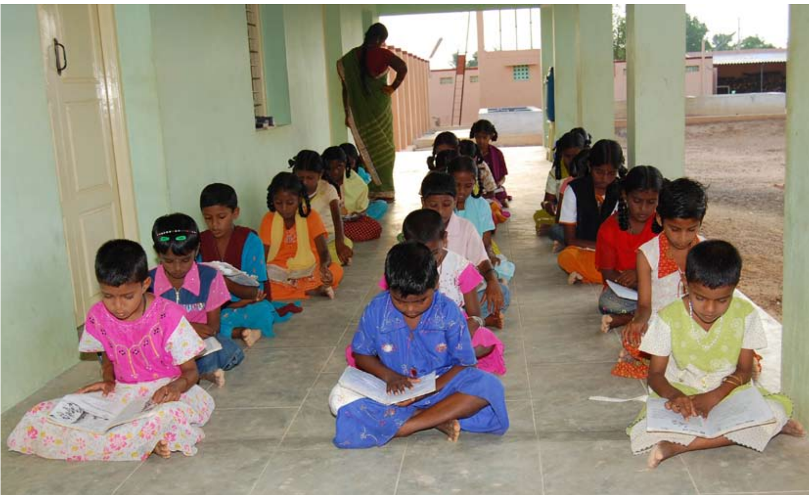
Flickorna läser läxor