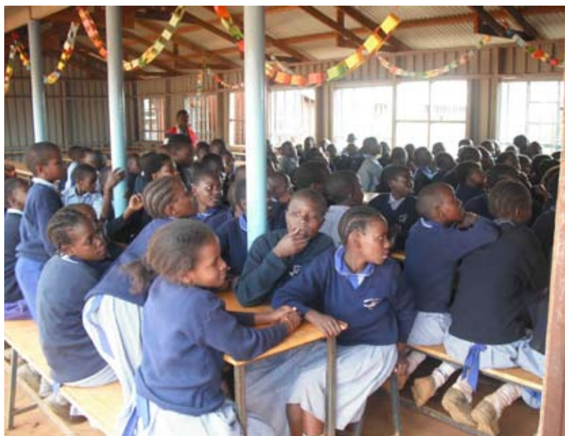
I väntan på skollunchen

Igår hade vi möjligheten att besöka en skola mitt i Nairobis största slumområde Kibera. Skolan heter Mashimoni Squatters Primary School och ger mer än 500 elever i årskurserna ett till åtta, inte bara utbildning utan också tillgång till rent vatten, mat, toaletter och ett utrymme med gräs och lite grönska. Kibera är annars ett trångt och skräpigt myller av plåtskjul och människor där tusentals barn lever i en inte alls barnvänlig miljö. Vi visades runt på skolan av en mycket ambitiös rektor med små och stora visioner - allt från t-tröjor till barnen för sport, datorer och ett litet laboratorium för undervisning i naturvetenskap till tillgång till el. Vi fick veta att skolan har en väldig hög acceptans i området och att eleverna är "sugna" på allt som erbjuds av skolan. Och det kunde vi verkligen se med egna ögon. Ett besök i Kibera må vara tufft, men den här skolan är verkligen en oas mitt i eländet.