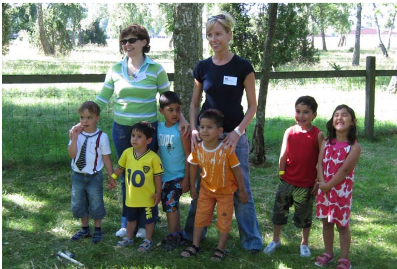
Vi är ett gäng på fem familjer som har adopterade barn från Slovakien.

Text Familjerna Dackéus, Edlund, Larsson, Rydståle och Svensson