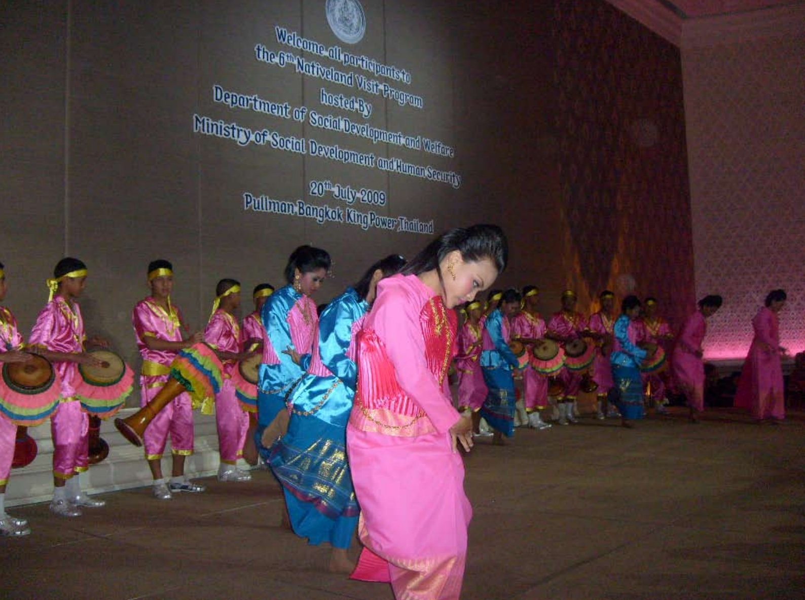
Invigningsceremonin till "Nativeland visit program", Bangkok.