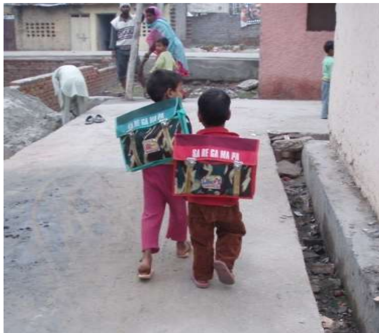
På väg till skolan, Delhi, Indien.

En del barn som saknar familj som kan ta hand om dem, bor på barnhem ex i Polen. Andra barn bor på barnhem/skolhem, som till exempel Annai Home for Children, i Tamil Nadu, Indien eller på klosterskolor som drivs av nunnor, som på Sri Lanka, ex Good Shepherd Convent och Lourdes Girls Home.