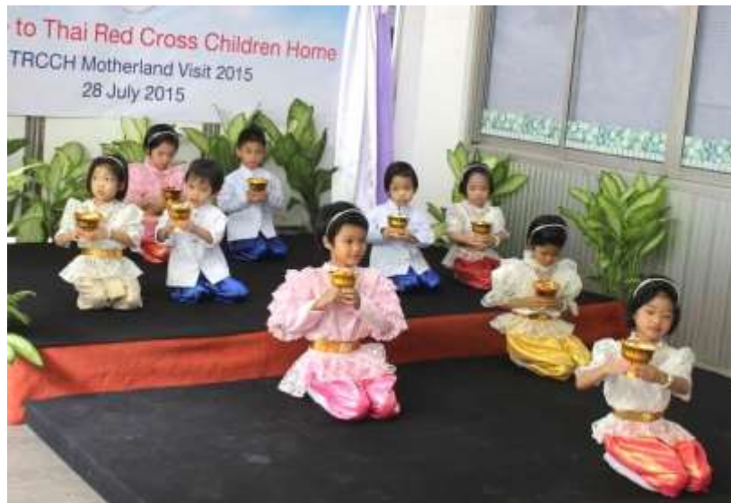
Besök i Thailand

adoptionssystemet i respektive land. Vi träffade också den thailändska prinsessan Maha Chakri Sirindhorn som har varit med och grundat barnhemmet och är mycket engagerad i barnhemmet. Under veckan besökte BFA även adoptionsmyndigheten DCY för att diskutera aktuella frågor.