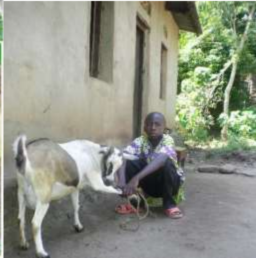
En get betyder mycket