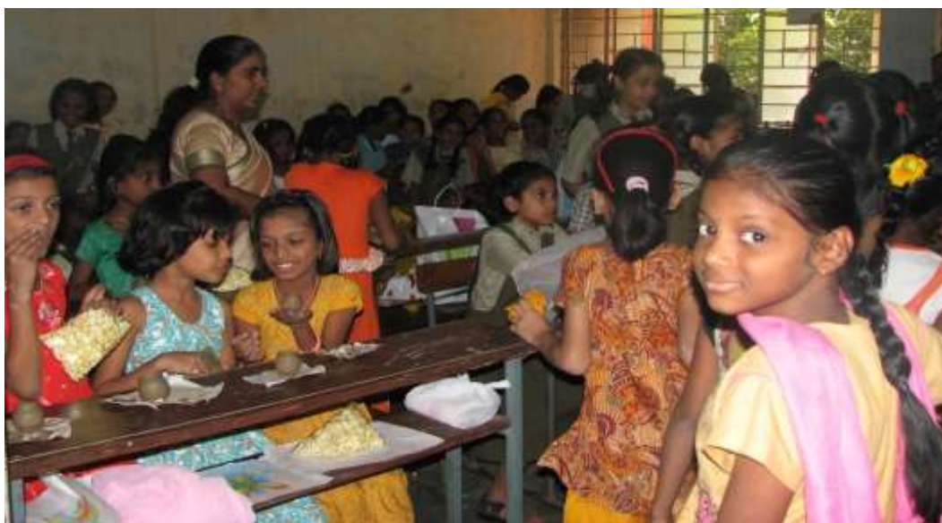
Kreativa elever samlas i skolan i Nagpur, Indien.

Normalt avslutas fadderstödet när barnen är 18 år och slutar gymnasiet eller om de börjar arbeta innan och slutar skolan. Det har visat sig att det finns ett intresse, såväl lokalt som bland faddrarna att fortsätta stödja de barn som vill läsa vidare på högre nivåer. BFA-fadder har därför även en fadderverksamhet för universitetsstuderande i Kongo. Under de senaste två åren har antalet akademiska fadderstudenter vuxit till 16 st.