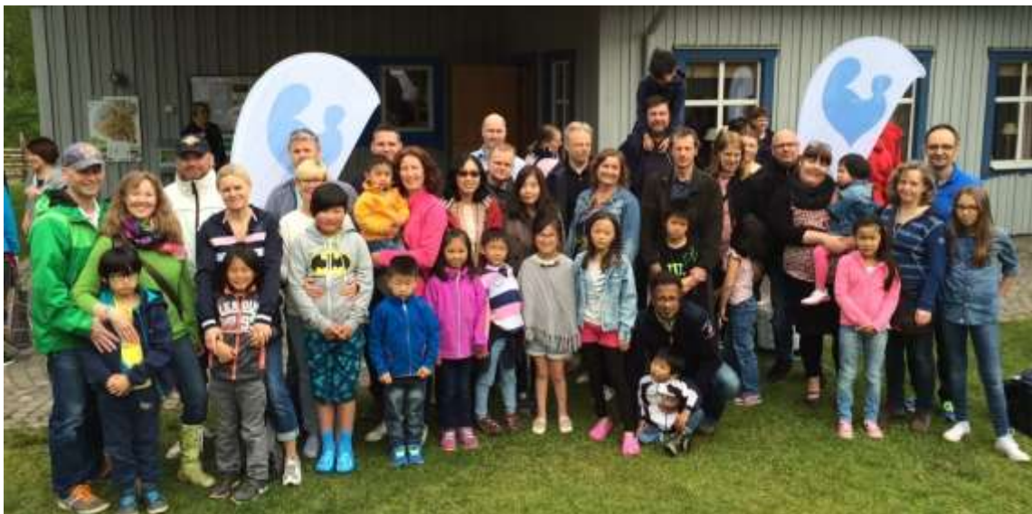
Några familjer vid sommarträffen

Sommarträffen arrangerades framför allt av ideella krafter. Under hela helgen fanns BFA:s biståndsbutik på plats vilket resulterade i en intäkt på ca 20 000 kr, vilket kommer gå till BFA:s bistånds och fadderprojekt i Litauen.