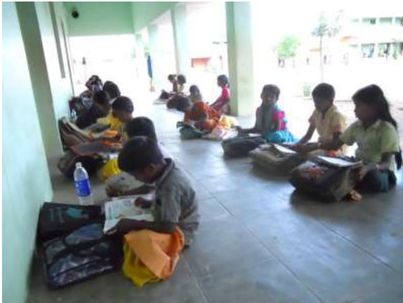
Läxläsning på Annai Home, Indien.

Föräldrarna till dessa barn är mycket fattiga. Oftast är det en ensamstående mamma med flera barn som saknar ekonomisk möjlighet att bekosta skolgången och därför har lämnat ett eller flera av sina barn att bo där under terminerna för att kunna få regelbunden skolgång och omvårdnad.