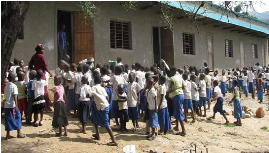
Skoldagen börjar i Uvira.

studenter kan ansöka om större bidrag till sin studier. Studierna följs upp genom regelbundna rapporter varje termin.