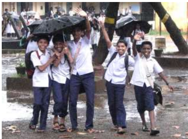
Glada skolbarn i Kerala.

En stor del av fadderbarnen bor i sina familjer men på grund av fattigdom kan föräldrarna inte bekosta barnens skolgång. De, drygt 160 barn, som vi t ex bistår genom samarbetet med CASP (Community Aid Sponsorship Programme) i Indien bor tillsammans med sina föräldrar liksom barnen i bl a Nepal, Kongo, Burundi och Vietnam.