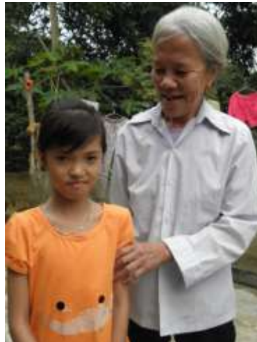
Fadderbarn i BFA:s och FBB:s fadderbarnsprojekt i Than Ba.