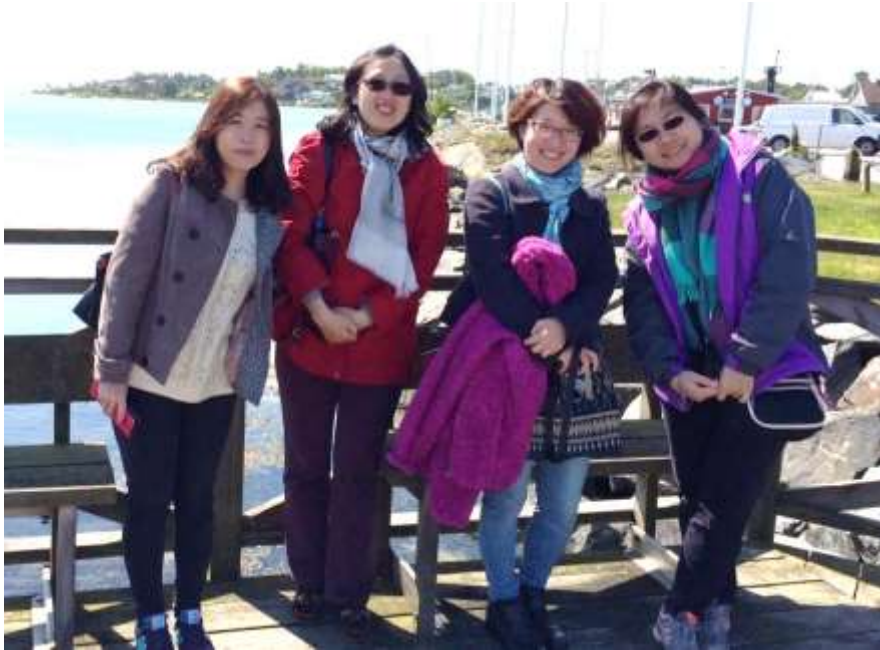
Gäster från Taiwan

Under 2015 kom det från Taiwan 17 barn till 19 familjer. Barnen var i åldrarna 1 – 7 år gamla vid ankomst till Sverige. 14 av dessa barn var över 3 år.