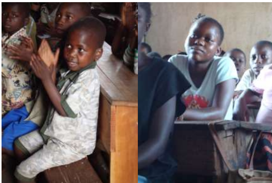
Elever i FEPAM-skolan i Uvira, en liten stad i östra Kongo Kinshasa

Vi kommer fortsatt att ge bistånd till skolbygget i Uvira i Kongo Kinshasa så att skolan kommer att kunna byggas ut efter de behov som finns och som ökat i och med att skolverksamheten har kommit gång.